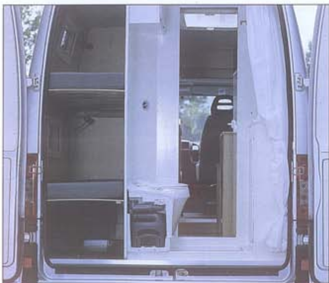
Heckansicht mit Aussenstauraum