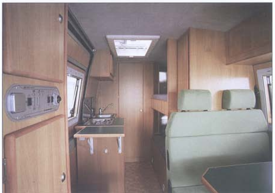
Küche und Sitzgruppe

Hinter der Schiebetür hat der Küchenblock seinen Platz. Integriert in diesen ist ein 90 l fassender Kompressor-Kühlschrank und ein Kocher mit integrierter Glasabdeckplatte