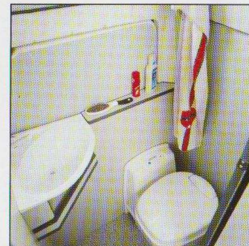
Waschraum mit Cassetten-Toilette