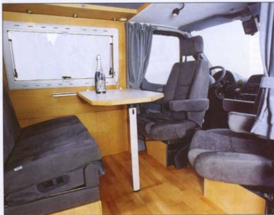
Sitzgruppe für 4 Personen