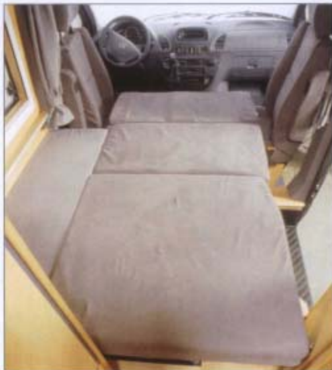
Liegefläche der umgebauten Sitzbank

Maximal möglicher Komfort herrscht im Bereich der Naßzelle. Hier haben wir eine feste Duschkabine in der Größe 80 x 70 cm vorgesehen sowie einen davon getrennten Bereich mit einer Cassettoilette und einem großzügig dimensionierten Waschtisch, alles ist mit Haushaltsarmaturen ausgestattet. Die gesamte Oberfläche im Bereich der Naßzelle ist extrem hochwertig und pflegeleicht beschichtet. Neben dem Sanitärkomfort haben wir ein besonderes Augenmerk auf den Schlafkomfort gelegt. Im Dach des Corona be-