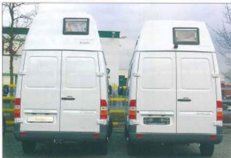
Hier kann man die unterschiedlichen Dachhöhen gut erkennen

wassertank, großem Licht-Hebeschiebedach, großzügig bemessenen Fenstern, allesamt aufstellbar, mit Kombirollos, bestmöglicher Isolierung, entspricht den höchsten Ansprüche, die an dieses Mobil gestellt werden können. Die Summe der Eigenschaften, die Qualität und das Ambiente, großzügige Serienausstattung und der Sanitärkomfort machen unser Modell Corona zu einem einzigartigen Fahrzeug, bei dem zudem jeder Kunden über ein hohes Maß an Mitspracherecht bei der Gestaltung seines Fahrzeuges verfügt.