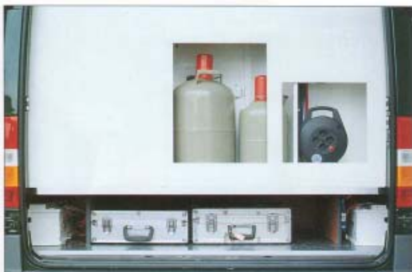
Heckansicht mit Außenstauraum

Die Staumöglichkeiten in unserem Modell Corona sind vielfältig. Der Kleiderschrank ist üppig dimensioniert, darüber hinaus gibt es Fächer für die Wäsche sowie großzügige Küchenschränke mit mehreren Vollauszügen um die Räume entsprechend gut zugänglich zu gestalten. Kocher und Spüle werden versenkt eingebaut und verfügen über eine integrierte Glasabdeckung.