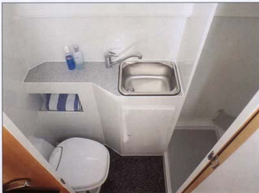
Naßzelle mit separater Dusche

findet sich das bereits bei anderen Modellen bewährte, abgesenkte Hubbett mit einer lichten Dachhöhe von etwa 65 cm über der einteiligen, hochwertigen Matratze. Die Bettabmessungen sind ca. 210 cm x 148 cm. Auf Kundenwunsch ohne Mehrpreis ist ebenfalls eine Version mit erhöhtem Dach lieferbar, bei dem