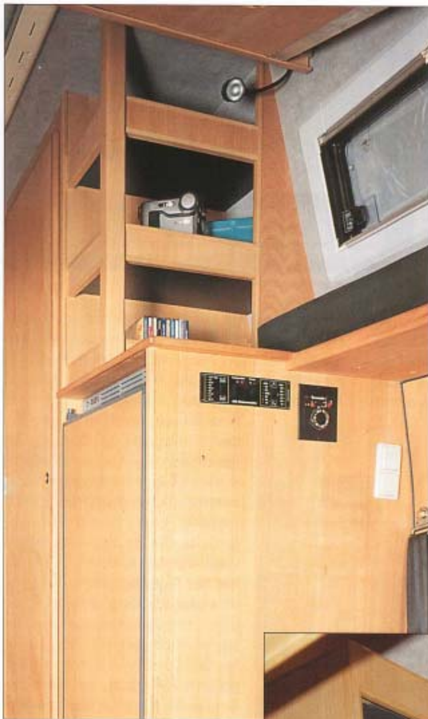
Kleiderschrank und die möglichen Einbaualternativen

die lichte Höhe oberhalb der Matratze ca. 78 cm beträgt. Bei dieser Version werden analog alle Dachstaukästen entsprechend angepasst und die Stehhöhe vergrößert.