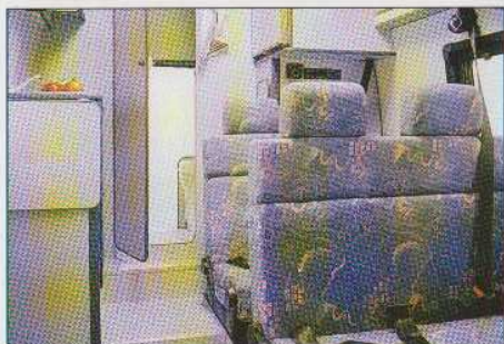
Sitzplätze umgebaut in Fahrstellung.