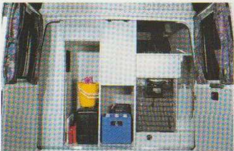
Heckansicht mit Staufächern.