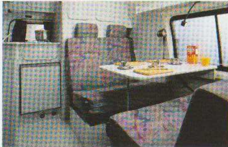
Sitzplätze im Wohnbereich.