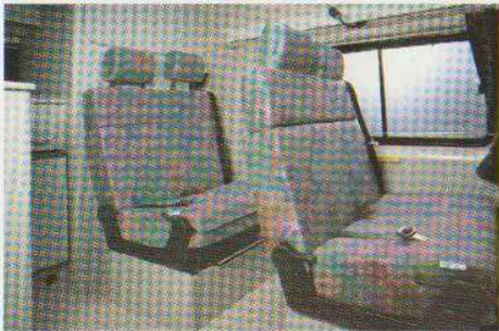
Sitzplätze umgebaut in Fahrtstellung.