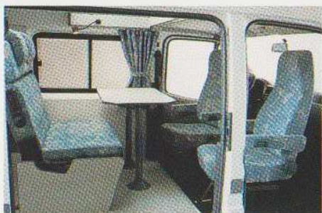
Sitzgruppe mit gedrehten Fahrerhaussitzen