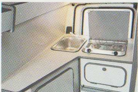
Winkelküche im Heck