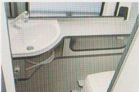
Waschraum mit Toilette