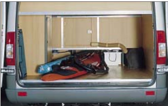
Stauraum unter Heckbett

Wie die Namensgebung nahe legt, gibt es eine enge Verwandtschaft mit unserem Modell Rondo auf Basis des Mercedes-Sprinter mit dem mittleren Radstand. Jedoch hat dieses Fahrzeug XL-Format. Wir haben es für die Kunden konstruiert, die einen Kastenwagen mit Stahlblechkarosserie und den entsprechenden Merkmalen dieser Art Karosserie schätzen, vor allem in Hin-