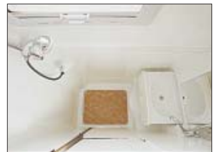
mit ausgezogenem Waschbecken