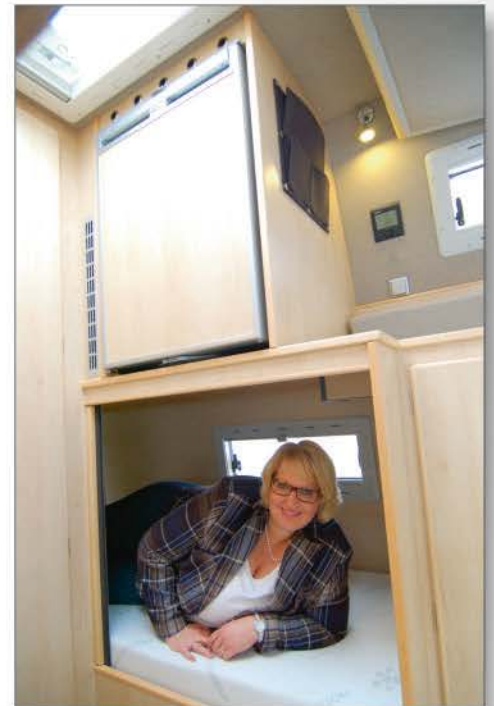
Einzelbett im Cargoraum

Hierzu zählt das vorn angeschlagene Hubbett mit Scharnier. Es ist mit einer 10 cm starken MDI-Schaummatratze ausgestattet und entsprechend komfortabel. Die Liegefläche beträgt ca. 2,10 m x 1,50 m. Zur Belüftung gibt es rechts und links ein Fenster sowie eine große Hebe-Schiebeluke (90 x 50 cm). Die lichte Höhe oberhalb der Matratze beträgt ca. 70 cm.