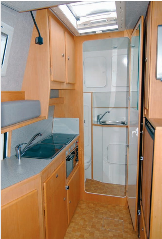
Küchenzeile mit Backofen, Blick in die Naßzelle

zum einem ein Höhenangleich mit den drehbaren Fahrerhaussitzen erreicht, zum anderen wird in diesem Doppelboden Warmluft transportiert, so dass man von einer Art Fußbodenheizung sprechen kann, mit Luft-Austrittsöffnungen in den besonders kritischen Bereichen der Schiebetür und der Fahrerhaustüren. Auf Wunsch wird der Doppelboden mit Echtholz-Parkett ausgestattet. Die Staumöglichkeiten in unserem Modell Corona sind vielfältig. Der Kleiderschrank ist großzügig bemessen, darüber hinaus gibt es Fächer für die Wäsche sowie geräumige Küchenschränke mit mehreren Vollauszügen. Kocher und Spüle werden versenkt eingebaut und verfügen über eine integrierte Glasabdeckung und Piezo-Zün-