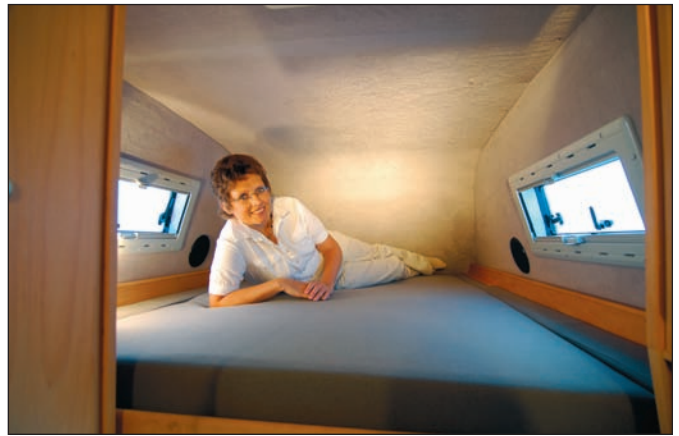
Großzügiges Hubbett im Dach

Unser Modell Corona basiert auf dem komplett neuen Mercedes-Sprinter mit dem Radstand 3.665 mm. Daraus ergibt sich eine Außenlänge des Fahrzeugs von 5,91m und eine Breite von 1,99 m. Die CDI-Motoren beginnen mit einer Leistung von 80 kW/109 PS im 4-Zylinderbereich. Optional gibt es als weitere Leistungsklassen noch 95 kW/129 PS bzw. 110 kW/150 PS. Als Spitzenmotorisierung ist ein 3-Liter V6 CDI-Motor mit 135 kW/184 PS ebenfalls im Angebot. Alle Motoren sind mit Partikelfiltern ausgestattet und entsprechen EURO 4. Serienmäßig sind die Fahrzeuge mit einem 6-Gang-Schaltgetriebe ausgestattet. Optional ist eine 5-Gang-Wandlerautomatik für alle Motorisierungsvarianten erhältlich. Wesentliche Sicherheitsausstattung – unter anderem ESP der neuesten Generation – aber auch ABS, ASR und Fahrer-Airbag sind genauso Serienstandard wie Zentralverriegelung mit Funk, elektrische Fensterheber, elektrisch einstellbare und beheizbare Außenspiegel sowie Wärmedämmglas im Fahrerhaus. Die Liste der