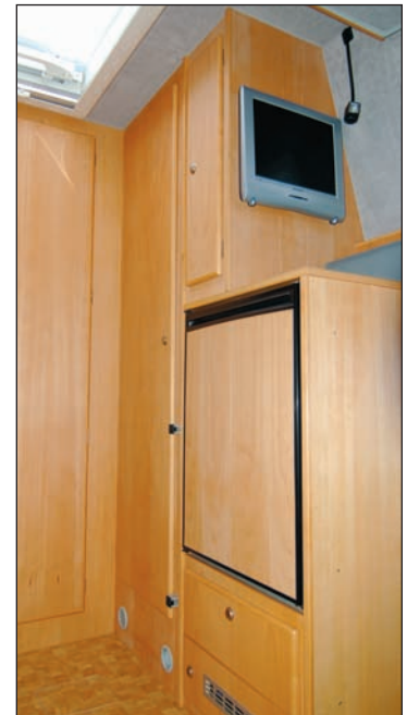
Kleiderschrank, Kühlschrank 110 l, TFT Monitor

Die Bordtechnik mit 110 l Kühlschrank, Kombi-Heizung C4002 mit 12,5 l Warmwasser der Firma Truma, GEL-Bordbatterie mit einer Kapazität von 235 Ah, 30 A Ladegerät mit IUoU Kennlinie,