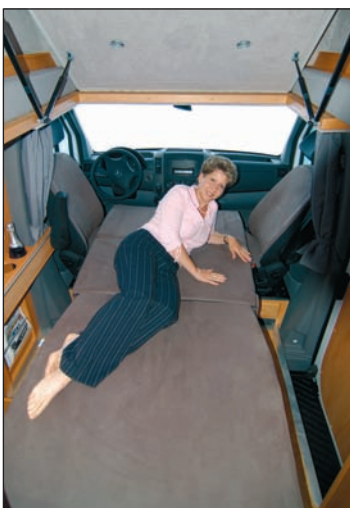
Zum Bett umgebaute Sitzgruppe

weiteren Sonderausstattungen ist lang und reicht von Allradantrieb bis Xenon-Licht. Wir liefern den Corona in einer speziellen Fahrwerksvariante mit verstärkten Stabilisatoren und verstärkten Stoßdämpfern, die für noch mehr Fahrsicherheit sorgt. Das zulässige Gesamtgewicht beträgt 3.500 kg. Dadurch unterliegt das Fahrzeug denselben gesetzlichen Bestimmungen wie ein PKW.