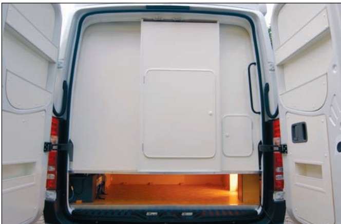
Heckstauraum, Gasflaschenfach und Ablagen in den Türen

zum einem ein Höhenangleich mit den drehbaren Fahrerhaussitzen erreicht, zum anderen wird in diesem Doppelboden Warmluft transportiert, so dass man von einer Art Fußbodenheizung sprechen kann, mit Luft-Austrittsöffnungen in den besonders kritischen Bereichen der Schiebetür und der Fahrerhaustüren. Auf Wunsch wird der Doppelboden mit Echtholz-Parkett ausgestattet. Die Staumöglichkeiten in unserem Modell Corona sind vielfältig. Der Kleiderschrank ist großzügig bemessen, darüber hinaus gibt es Fächer für die Wäsche sowie geräumige Küchenschränke mit mehreren Vollauszügen. Kocher und Spüle werden versenkt eingebaut und verfügen über eine integrierte Glasabdeckung und Piezo-Zün-