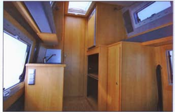
Kleiderschrank, Kühlschrank hochgestellt und Cargoraum

schließlich aus hochwertigen Halogenleuchten, die so zahlreich sind, dass eine hervorragende Ausleuchtung des Fahrzeugs gewährleistet wird. Selbstverständlich sind 12- und 220-V-Steckdosen an Bord. Die Gasversorgung erfolgt über zwei Flaschen mit 11 kg Inhalt, die bequem im Heck des Fahrzeugs zugänglich sind. Der Möbelbau besteht grundsätzlich aus 15 mm Pappelsperholz mit HPL-Schichtstoff, lieferbar in diversen Dekoren. Alle Kanten sind generell in Echtholz ausgeführt. Natürlich besteht auch die Möglichkeit, das Fahrzeug mit einem kompletten Echtholzausbau zu bekommen, genauso wie mit Parkettfußboden. Die Isolierung aus 20 mm PE-Schaum erfüllt höchste Ansprüche. Darüber hinaus gehören Isotherm-Matten für die Fahrerhausscheiben zum Serienstandard ebenso wie ein Rundumvorhang im Fahrerhaus. Optional sind Solaranlagen, automatische Sat-Anlagen nebst TFT-Monitor genauso lieferbar wie Navigationsgeräte oder Fußbodenheizung. Die zahllosen Möglichkeiten – nicht nur in der Einrichtung des Cargoraums – sorgen bei jedem Fahrzeug für ein individuell gefertigtes Einzelstück in herausragender Qualität.