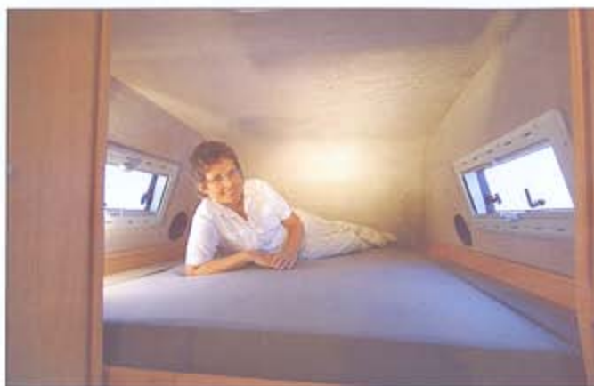
Großzügiges Hubbett im Dach

Der Wunsch vieler Reisemobilisten, Fahrräder, Motorroller, faltboot oder ähnliches nicht außerhalb des Fahrzeugs zu belassen sondern im Fahrzeug unterzubringen, hat uns veranlasst, das Modell Cosmo zu entwickeln. Kernstück des Innenausbau ist deshalb der 1,90 x 1,45 x 0,75 m große Heckstauraum, der sehr leicht durch die Hecktüren zu erreichen ist. Die Einrichtung dieses Cargoraums ist variabel und kann nach Kundenwunsch gestaltet werden. Verzurrösen an den Seitenwänden sowie Schienen auf dem Boden sind ebenso möglich wie eine Unterteilung mit Fächern. Serienstandard im Cargoraum ist zudem ein klappbares Bett, das eine Länge von 1,90 m und eine Breite von 0,75 m hat. Darüber hinaus ist es