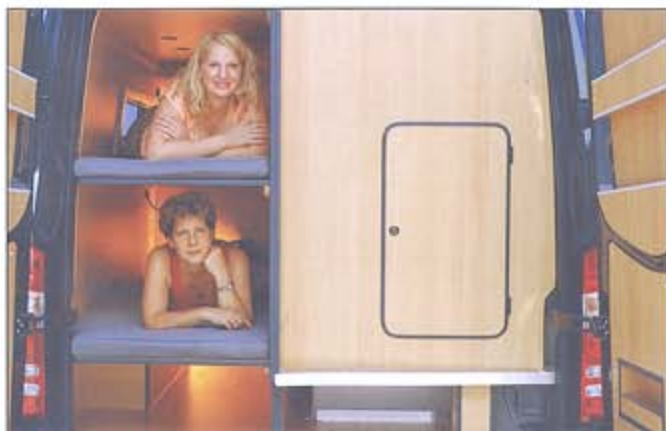
Cargoraum mit optionalen Stockbetten

des Frischwassertanks ist mit ca. 150 l für Kastenwagen sehr großzügig dimensioniert, der Abwassertank fasst 100 l. Beide Tanks sind – bedingt durch die Anordnung im Doppelboden – absolut frostsicher. Der Küchenblock auf der rechten Fahrzeugseite entspricht mit versenktem und abdeckbarem Kocher (mit Piezo-Zündung) und Spüle, Haushaltsarmatur und hochwertigen Auszügen dem hohen CS-Standard. Optional lässt sich die Kückeneinrichtung um einen Backofen erwei-